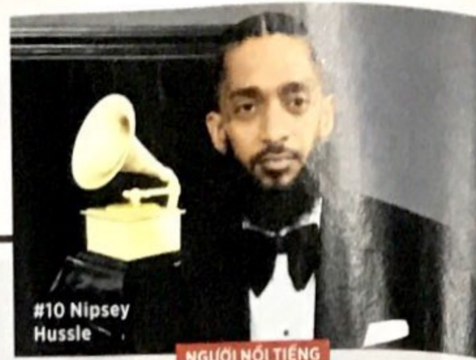
#10 Nipsey Hussle