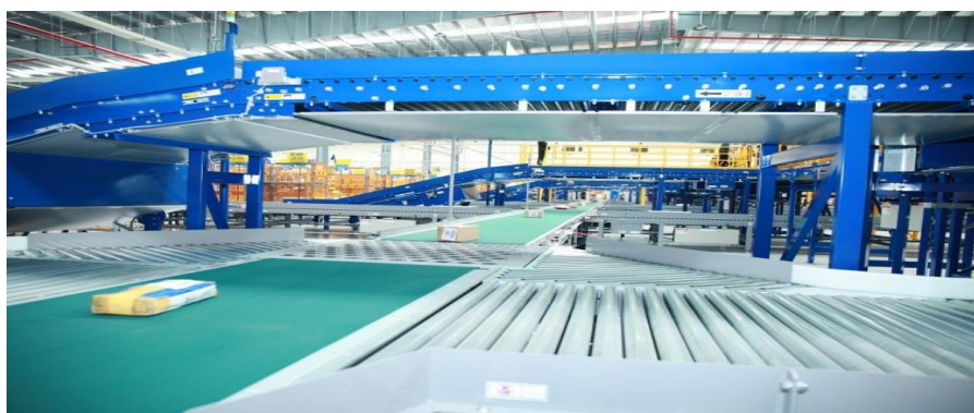
Ảnh: Hệ thống dây chuyền khai thác chia chọn tự động của Trung tâm VCKV khu vực phía Nam

Hiện tại, logistics là một ngành dịch vụ quan trọng trong cơ cấu tổng thể nền kinh tế quốc dân bởi đây là chi phí đầu vào của mọi hoạt động sản xuất. Theo Hiệp hội Doanh nghiệp dịch vụ logistics Việt Nam, tốc độ phát triển của ngành logistics nước ta những năm gần đây đạt khoảng 14%-16%, với sự tham gia của khoảng 3.000 doanh nghiệp trong nước và khoảng 25 tập đoàn giao nhận hàng đầu thế giới. Tiềm năng phát triển dịch vụ logistics Việt Nam là rất lớn. Trong tương lai không xa, dịch vụ cung cấp logistics sẽ trở thành ngành kinh tế quan trọng, có thể đóng góp tới 15% GDP của cả nước.