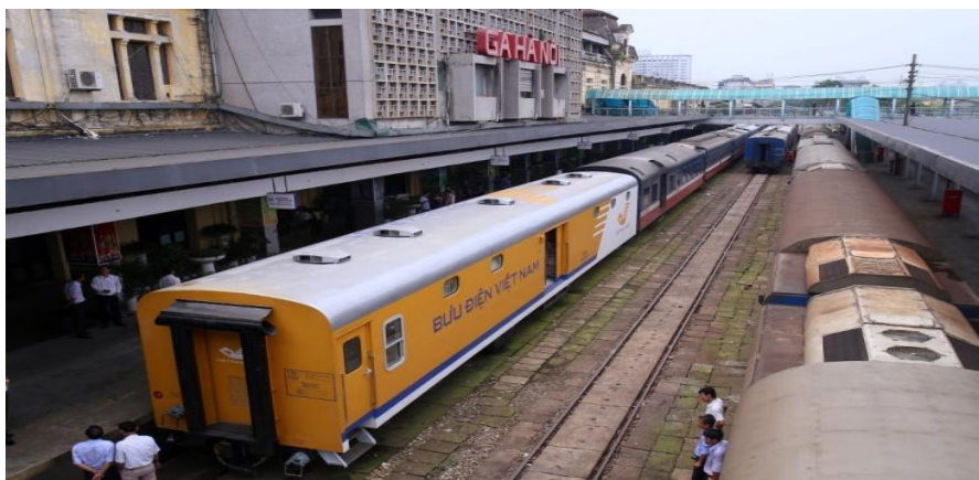
Ảnh: Đoàn tàu vận chuyển của Vietnam Post đi vào hoạt động đã góp phần giảm chi phí logistics đáp ứng nhu cầu của khách hàng

Đối với một doanh nghiệp có mạng lưới bao phủ rộng khắp cả nước và xuống tận cấp xã như Vietnam Post, việc tối ưu hệ thống kho bãi cũng là ưu tiên. Hiện Vietnam Post cũng đang tiến hành xây dựng 7 trung tâm vận chuyển và kho vận vùng, hình thành 3 trung tâm lớn tại TP. Hồ Chí Minh, Hà Nội và Đà Nẵng và tung ra giải pháp toàn diện cho các cửa hàng online, từ quảng cáo, chuyển phát, thu tiền đến hậu mãi.