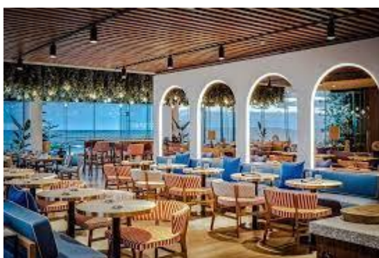
Hình 1.1: Hình ảnh không gian nhà hàng