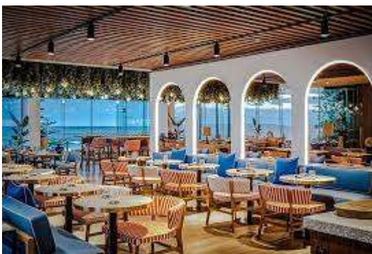
Hình 1.1: Hình ảnh không gian nhà hàng